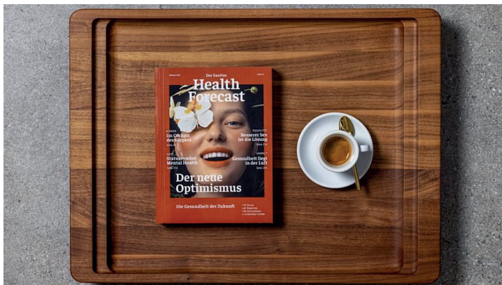
Der Sanitas Health Forecast – Edition 2021, «Der neue Optimismus»

Der Sanitas Health Forecast beleuchtet auf über 400 Seiten die grössten internationalen Gesundheitstrends.